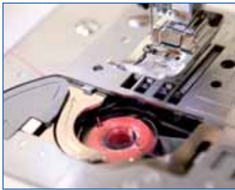
Unterfaden-Schnellautomatik Volle Spule einlegen, Faden einlegen und es kann losgehen

Automatisch Vernähen/Rückwärts – Verriegelungsstiche am Nahtanfang und -ende sichern die Naht und schaffen ein perfektes, professionelles Stichbild.