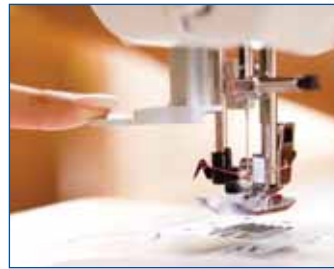
Automatischer Nadeleinfädler Ein Griff genügt und der Faden ist in der Nadel