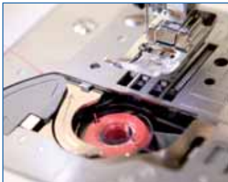
Unterfaden-Schnellautomatik Volle Spule einlegen, Faden einlegen und es kann losgehen

Automatisch Vernähen/Rückwärts – Verriegelungsstiche am Nahtanfang und -ende sichern die Naht und schaffen ein perfektes, professionelles Stichbild.