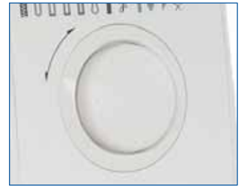
Elektronisches Funktionsrad Schnelles und einfaches Auswählen der Stiche