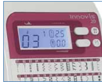
LC Display Hier haben Sie alle wichtigen Informationen im Blick