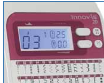
LC Display Hier haben Sie alle wichtigen Informationen im Blick