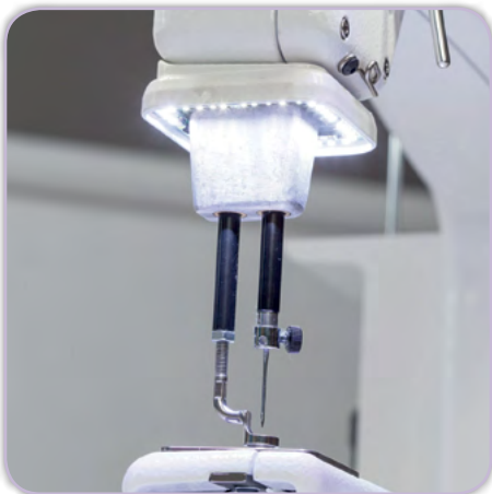
LED-Leuchtring im Quiltbereich

Ihr Durchgangsraum bis 18 inch ist beeindruckend, die Verarbeitung ist hochwertig und präzise und die Stichregulierung erleichtert Ihnen das Quilten enorm. Legen Sie individuell Ihre Stichlänge fest, die Avanté passt automatisch die Nähgeschwindigkeit Ihrer Bewegung an und behält dabei die Stichlänge bei. Apropos Bewegung – hier bewegen Sie die Maschine