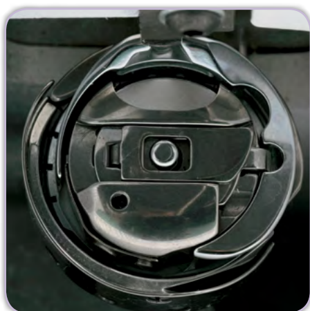
Robuster Doppelumlaufgreifer mit großer Fadenspule