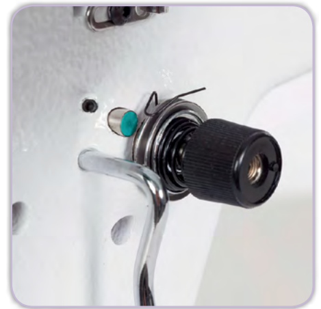
Patentierter digitale Fadenspannungseinstellung