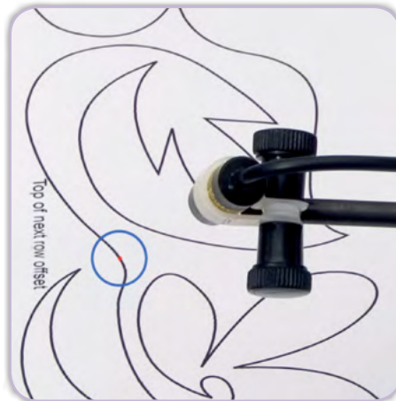
Laser im Einsatz