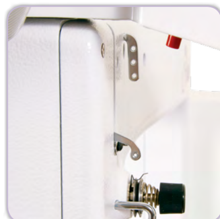
Ein- / Ausschalter am Maschinenkopf