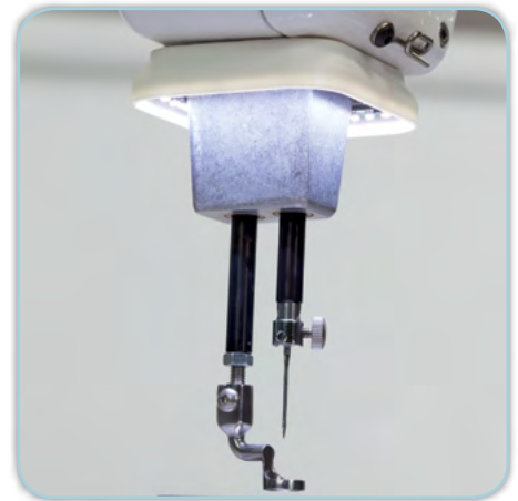
LED-Lichtring im Nadlebereich, warmes, kaltes, neutrales, UV-Licht