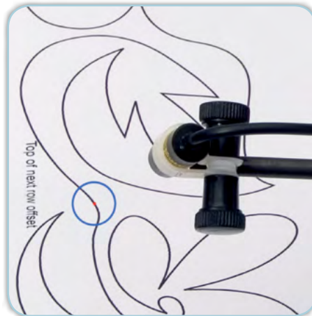
Laser im Einsatz