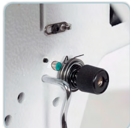
Digitale patentierte Fadenspannungseinstellung