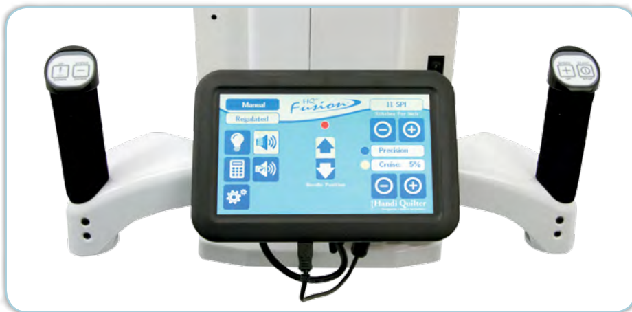
Bedienelement am hinteren Maschinenkopf mit farbigem Touch-Screen, leichte Handhabung durch Knöpfe in den Griffen