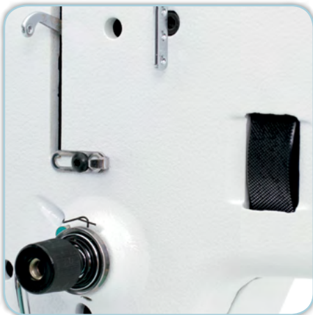
Manuelles Handrad am Maschinenkopf

Für den Profi- und den Hobby-Quilter genau die richtige Maschine. Die Größe der HQ Fusion ist beeindruckend und mit Leichtigkeit schwebt sie förmlich über den Quilt. Das Ergebnis kann sich sehen lassen und Sie werden sich sagen: „Warum besitze ich die HQ Fusion nicht schon seit längerem?“ Gönnen Sie sich die HQ Fusion, steigen Sie auf in das nächste Level der Longarm-Quiltmaschinen und vereinfachen Sie sich das Arbeiten an Ihren Quilts. Mit einem Durchgangsraum von 24 inch erhalten Sie zum Quilten eine Fläche in der Tiefe von ca. 20 inch.