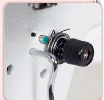
Digitale patentierte Fadenspannungseinstellung